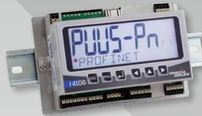
I 410 G Rail DIN