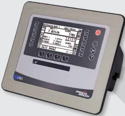
I 410 D encastrable