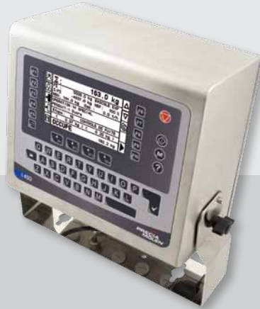
I 410 D-S boîtier inox