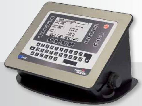
I 410 T version table